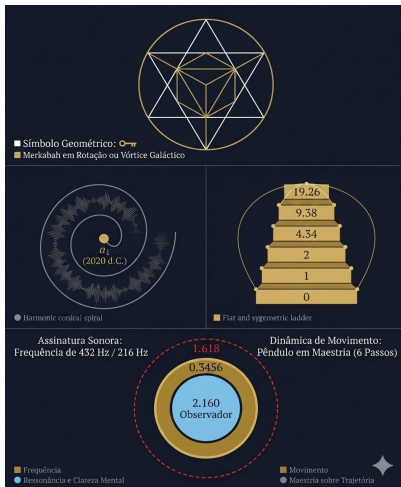
Fig. 2 – Arquitetura gráfica